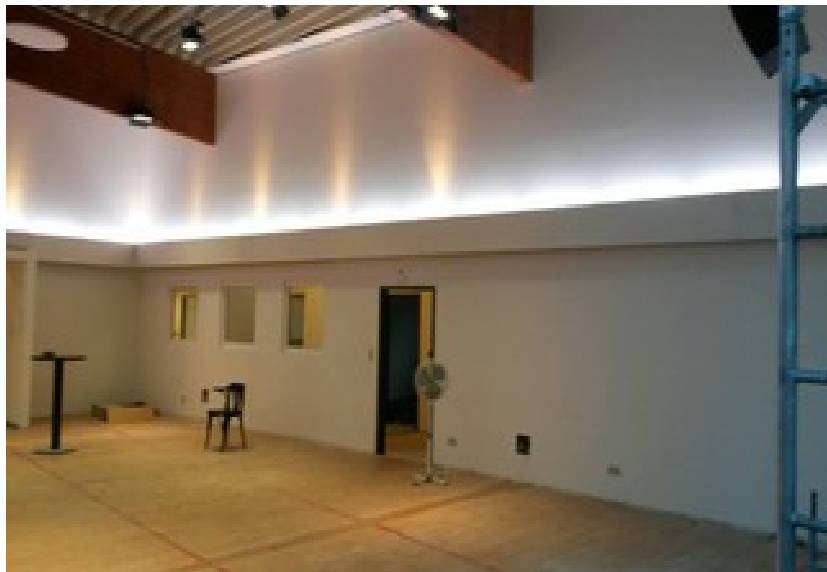
Der Gottesdienstraum - bald kann bestuhlt werden...

Genauer gesagt, bei Erscheinen dieses Gemeindebriefs sind wir bereits in den neuen Gemeinderäumlichkeiten: der erste Gottesdienst nach dem Umzug findet am 2. April statt.